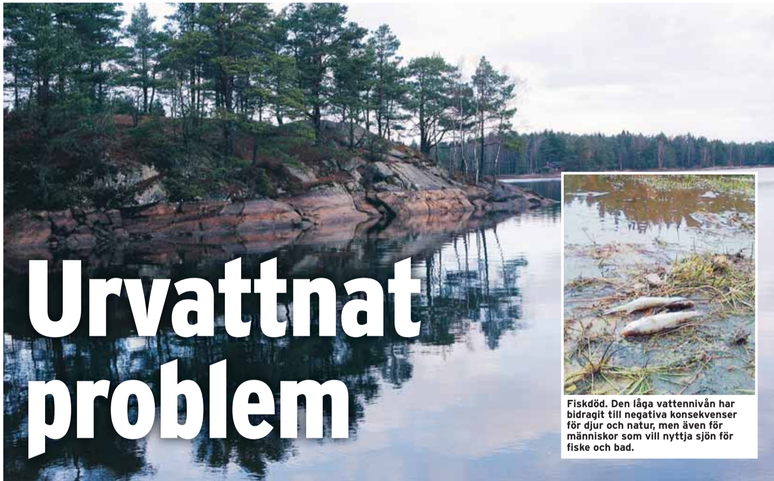
Sänkt vattennivå. Randen på berget visar tydligt var vattennivån i vanliga fall brukar ligga i Mollsjön.