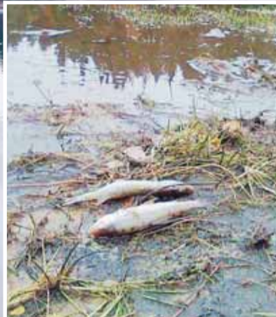
Fiskdöd. Den låga vattennivån har bidragit till negativa konsekvenser för djur och natur, men även för människor som vill nyttja sjön för fiske och bad.

– Man har försökt att erbjuda ersättning för att kompensera de förlorade inkomsterna, men det skiljer mycket mellan vad kommunen kan erbjuda och vad ägaren är beredd att godta. Det handlar om stora belopp. Jag har själv varit med och drivit den här frågan och