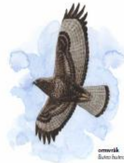
omvärk Buteo buteo

Gamla, grova ekar är hem för en lång rad växter och djur. Men många av dessa är idag hårt trängda, eftersom det råder brist på gammlekar. De gammlekar som står i hagmarken är därför mycket värdefulla. Ekarna gynnas av att marken betas eller slås, för då slipper de konkurrens från andra träd. Gynnas gör även en rad ljuslskande växter som ängsvädd, gökört, hirstarr, prästkrage och blåklöcka.